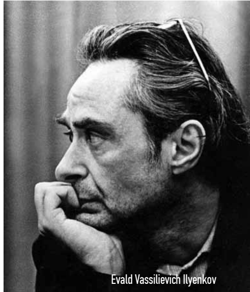
Evald Vassilievich Ilyenkov

Αυτός είναι ο λόγος για τον οποίο η εξάπλωση των κομμουνιστικών ιδεών στη Γαλλία και την Αγγλία αποτιμήθηκε από τον Μαρξ ως ένα σύμπτωμα της πραγματικής αντίθεσης που ωρίμαζε