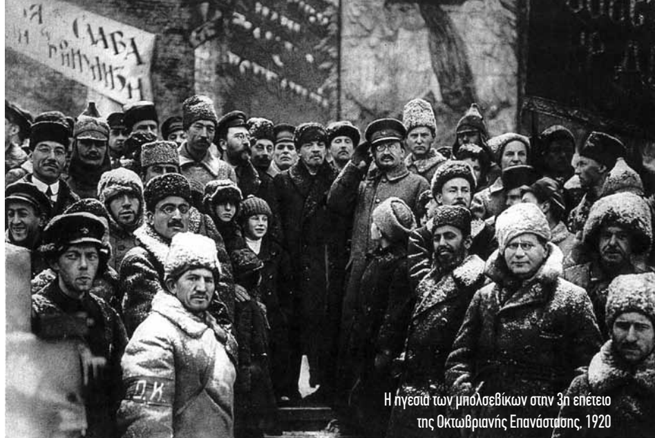
Η ηγεσία των μπολσεβίκων στην 3η επέτειο της Οκτωβριανής Επανάστασης, 1920

Σοβιετικής Δημοκρατίας στην Ουγγαρία, ενώ τρεις αντεπαναστατικές στρατιές από Ανατολή, Βορρά και Νότο πλησιάζουν στην Πετρούπολη και στη Μόσχα. Ακόμα και μετά τη συντριβή τους, θα ακολουθήσει η πολωνική εισβολή. Σ' αυτές τις συνθήκες, ο φορέας που μπορεί να συσπειρώσει και να κινητοποιήσει τις μάζες είναι το Κόμμα. Οι μπολσεβίκοι εκκαθαρίζουν τις γραμμές τους από καιροσκόπους οι οποίοι είχαν εισχωρήσει μετά την Οκτωβριανή Επανάσταση και ταυτόχρονα στρατολογούν νέα μέλη. Αυτά, σύμφωνα με τον Λένιν, είναι άπειρα και αδέξια στην κρατική διαχείριση, αλλά η φρεσκάδα, η αντοχή, η ευθύτητα, η αφοσίωση και η ειλικρινειά τους τα καθιστά ικανά να αντιμετωπίσουν τη γραφειοκρατία, να ξανασυνδέσουν το κράτος με τις μάζες και να καταπολεμήσουν τους υπονομευτές της σοβιετικής εξουσίας (Λένιν, 1919θ: 235). Τον Μάρτιο του 1920 το κόμμα των μπολσεβίκων αριθμεί 612.000 μέλη, από τα οποία 270.000 είναι εργάτες (Μπετελέμ, 1974: 198· Προκάτσι, 1975: 11-13), γεγονός που δείχνει την πολιτική εμπιστοσύνη των μαζών σ' αυτό, όπως και η ανταπόκρισή τους στα διαδοχικά καλέσματα είτε στα μέτωπα των πολεμικών μαχών είτε στην εξασφάλιση του επισιτισμού. Όμως, η επιδείνωση του συσχετισμού των δυνάμεων συνεπάγεται, εκτός από την έμφαση στο ρόλο του Κόμματος,