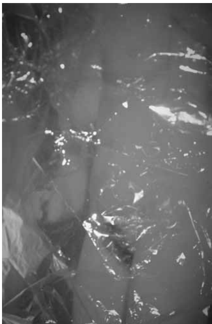
Το γυμνό κορμί της «Σοφίας» σε σελοφάν